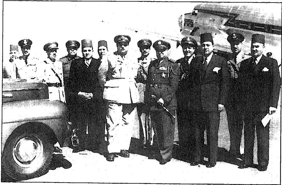
الملك فاروق وعلى يمينه كريم ثابت